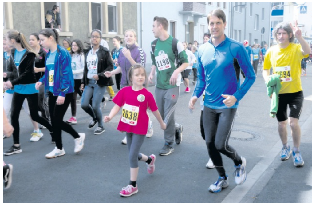
Groß und Klein sind unterwegs in den Straßen von Bruchsal beim großen Lauferlebnis „Hoffnungslauf“.

es, dass am Ende sicherlich wieder eine hohe Summe unter dem Strich erreicht wird. Diese ergibt sich aus den Startgeldern, Einzelspenden und Spendenpatenschaften. Im Vorjahr waren es rund 40000 Euro.