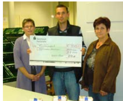
Zwei ehrenamtliche Mitarbeiterinnen des Vereins Kreuz und Quer aus Stutensee überreichen der Tafel einen Scheck über 500 Euro.