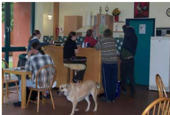
Die Tagesstätte - oder auch „Wärmestube“ - im Julius Itzel Haus soll umgestaltet und stärker an den Bedürfnissen der Obdachlosen angepasst werden.

Die Hilfen im Julius Itzel Haus reichen von der ambulanten Fachberatung über das Betreute Wohnen