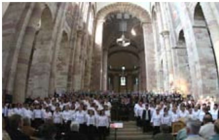
Die 500-köpfige Chorgemeinschaft Wolfgang Tropsch (hier beim Benefizkonzert im Speyerer Dom) singt am Samstag, 6. Oktober 2007, in Karlsdorf-Neuthard zu Gunsten des Ökumenischen Hospizdienstes Bruchsal.