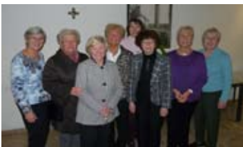
Das Organisationsteam der Frauengruppe St. Paul unterstützte den Mittagstisch mit einer Spende.

400 Euro hat die Frauengemeinschaft St. Paul für den Mittagstisch gespendet. Das Team konnte bereits im Spätherbst den Betrag überreichen und somit dem Projekt eine willkommene Finanzspritze geben. Die Frauengemeinschaft bietet zahlreiche Veranstaltungen für die Damen der Pfarrei und alle Interessierten an und ist mit 180 Mitgliedern die größte Gemeinschaft der Pfarrei St. Paul.