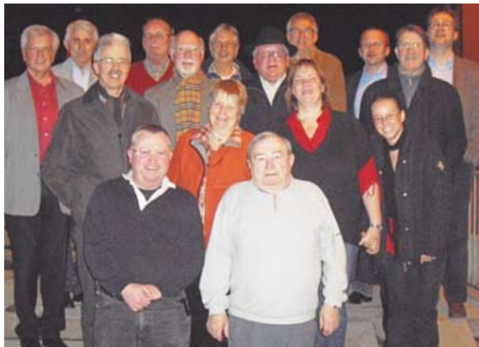
Ein Teil der AsS-Paten und die Mitarbeiter/innen des Caritasverbandes, die in den letzten sechs Jahren in Bruchsal und Umgebung 300 Jugendliche in Arbeit oder Ausbildung vermittelt haben.

für interessierte Paten oder Jugendliche sind beim Caritasverband Bruchsal unter Telefon (0 72 51) 80 08 73 erhältlich.